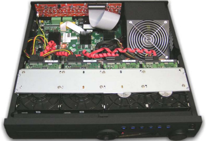
Устройство видеорегистратора – установлено 8 жестких дисков