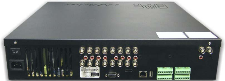
Вид сзади (вход питания 220 В, входы видео, входы звука, выход видео, VGA, HDMI, сеть, USB, тревожные входы/выходы, RS-232, RS-485)