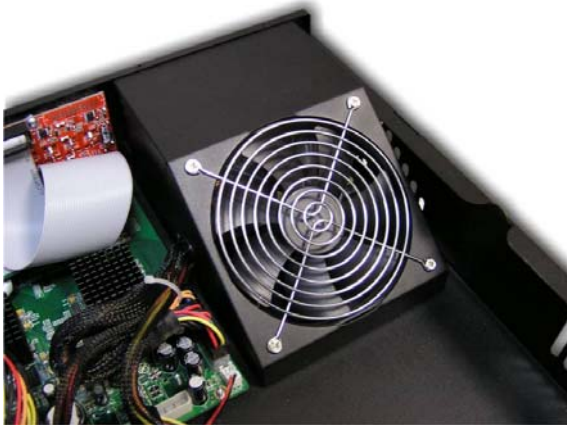
Система вентиляции на база вентилятора диаметром 12 см